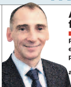
ABB byter chef för kraftdivisionen

■ Förra året minskade produktionen i skogsindustrin. Tillverkningen av massa, papper och sågade trävaror sjönk. Värdet av hela skogsindustriexporten beräknas ha minskat från 129 till 122 miljarder kronor, enligt Skogsindustrierna. (TT)